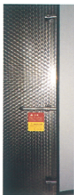
■エムスハンドル 庫内3点締付

ドアヒーター (サーモスタット不要) ドア枠に埋込まれたセルフコントロールヒーター 100V・200Vを用意してあります 配電函に電源を投入するだけでOK。